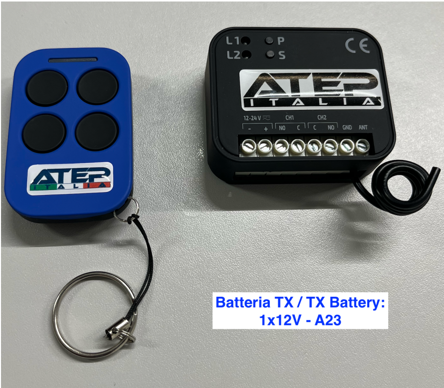
Batteria TX / TX Battery: 1x12V - A23

E' POSSIBILE SCANSIONARE IL QR CODE APPLICATO SUL RETRO DEL TELECOMANDO PER VISITARE LA NOSTRA PAGINA WEB DOVE SI PUO' SCARICARE IL PDF DELLE ISTRUZIONI DI PROGRAMMAZIONE